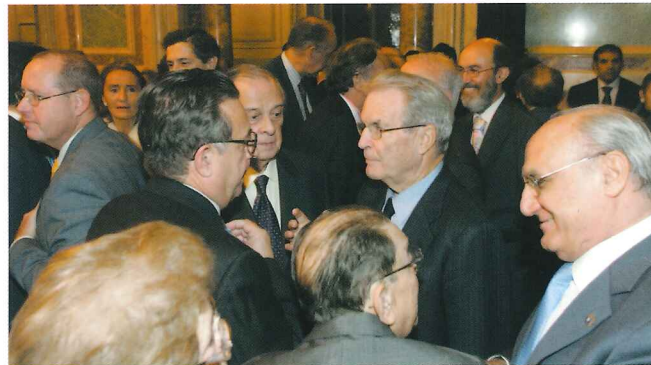
El galardonado de la XIII edición, el Presidente del Jurado, el Presidente del Bufete Garrigues y el Presidente del Consejo General del Poder Judicial.