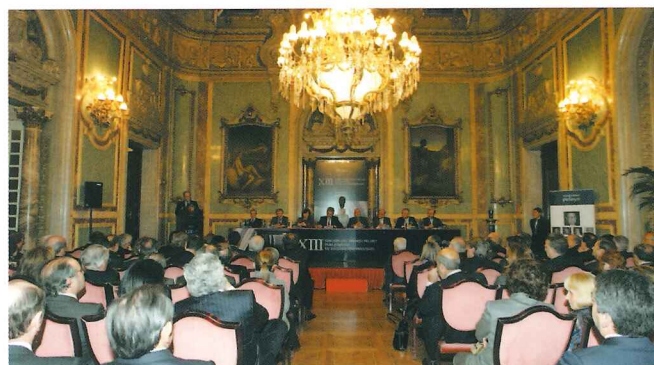
Vista general de la sala principal.