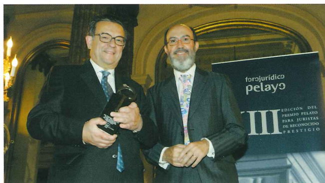
El galardonado de la XIII edición y el Presidente de Pelayo.