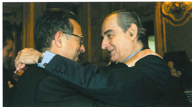
El galardonado de la XIII edición y el Presidente de la Fundación Pelayo y de la Real Academia de Jurisprudencia y Legislación.