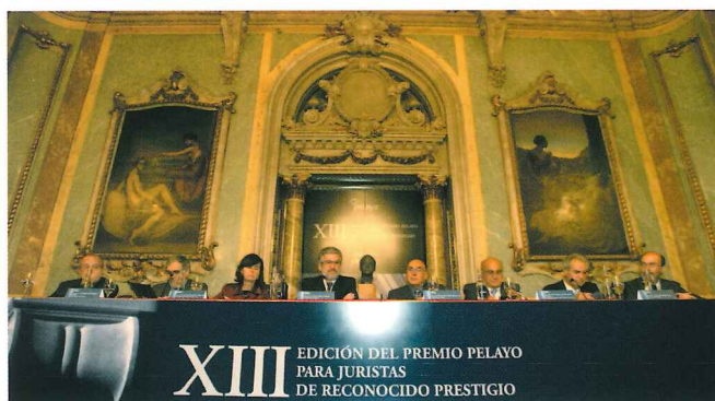
En la mesa: el Presidente del Jurado, el Fiscal General, la Presidenta del Constitucional, el Presidente del Congreso, el Presidente del Senado, el Presidente del Consejo General del Poder Judicial, el Defensor del Pueblo y el Presidente de Pelayo.

Al acto, celebrado en el Casino de Madrid, acudieron cerca de 800 personas procedentes de distintos colectivos: el Jurado en pleno, representantes del Consejo General del Poder Judicial, Tribunal Supremo, Tribunal Constitucional, Consejo de Estado, Fiscalía, Audiencias y Magistraturas; así como Parlamentarios, Letrados y Procuradores de los más prestigiosos despachos y máximos representantes de la Universidad y de la política.